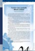
História de almanaque