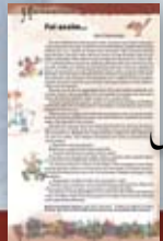
História de almanaque