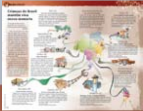
Onde está o futuro