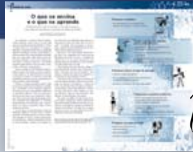
Tirando de letra