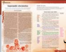
Tirando de letra