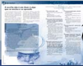
De olho na prática