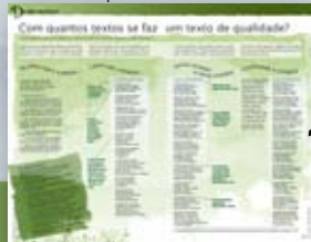
De olho na prática