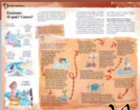
De olho na prática