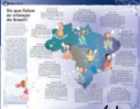
Onde está o futuro