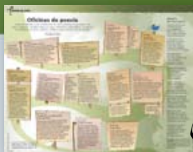
Tirando de letra