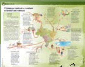
Onde está o futuro